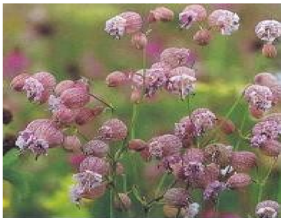
Silene vulgaris ssp. vulgaris